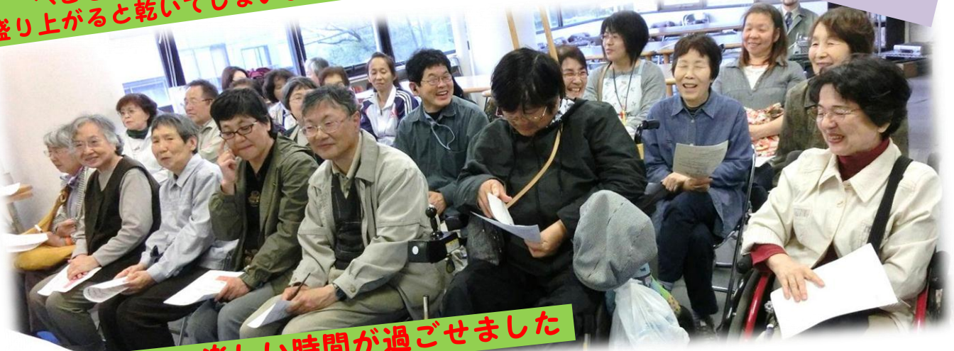
なごやかに楽しい時間が過ごせました