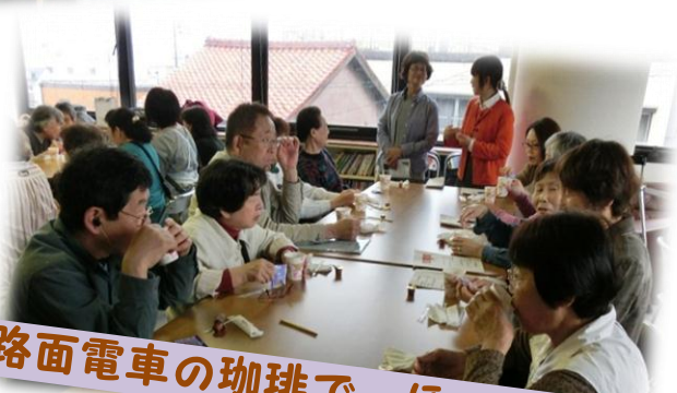
路面電車の珈琲で、ほっと一息