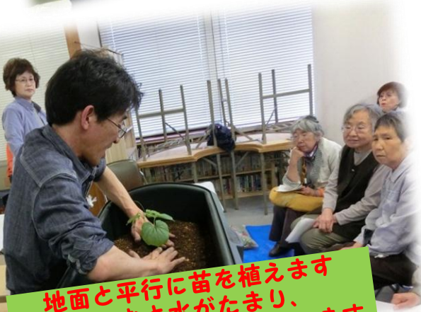
地面と平行に苗を植えます へこむと水がたまり、 盛り上がると乾いてしまいます