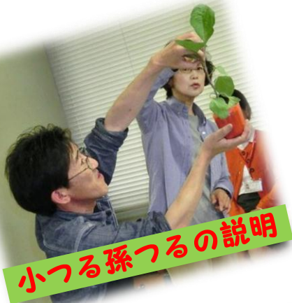
小つる孫つるの説明