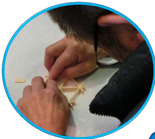
作業体験② 組子細工