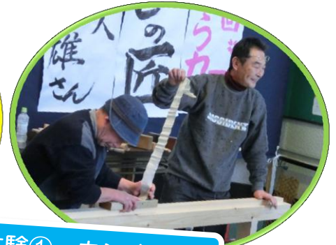
作業体験① カナナ削り