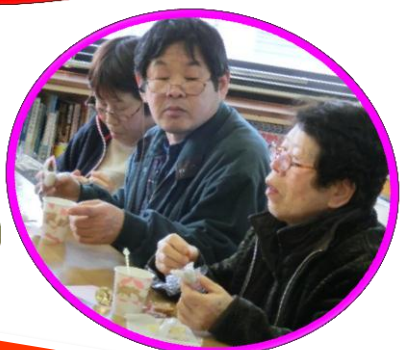
路面電車さん出張カフェ