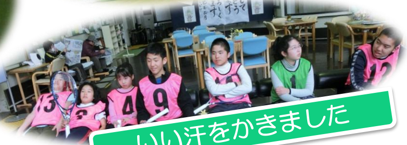
いい汗をかきました