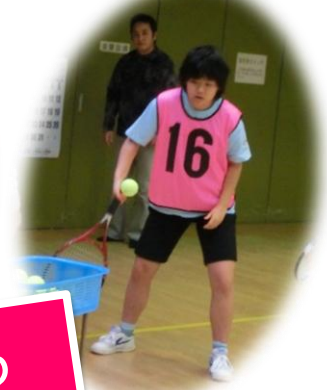
実際にボールを打ってみよう