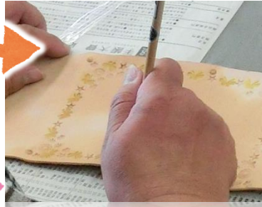
② 地と絵柄に色塗り