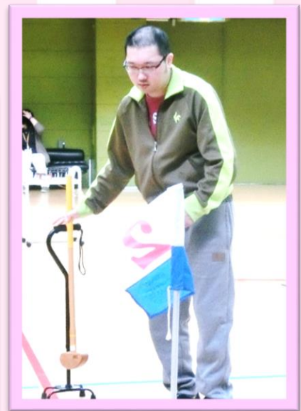
第1回グラウンドゴルフ