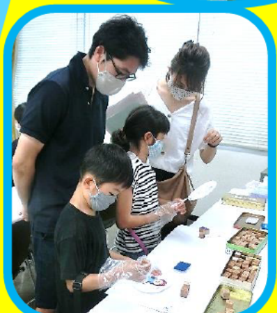
指文字スタンプコーナー