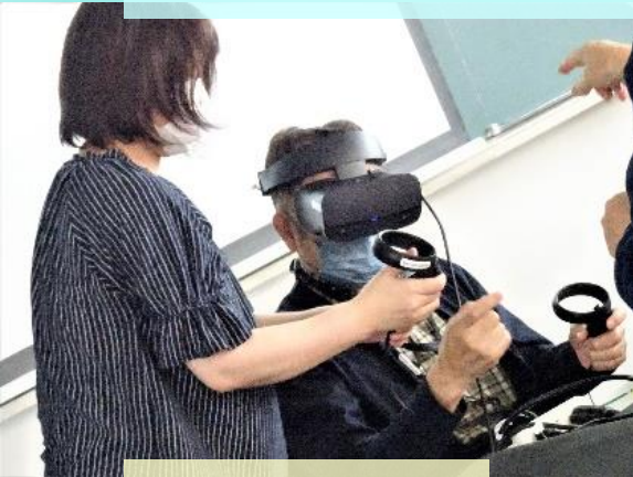
VR ヘッドセットを装着