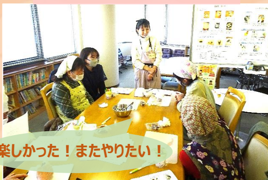
楽しかった！またやりたい！