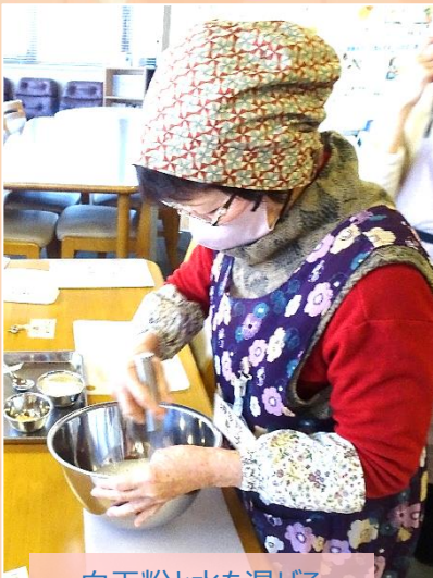
白玉粉と水を混ぜる