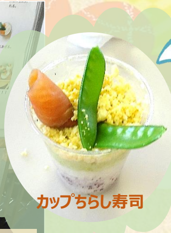
カップちらし寿司