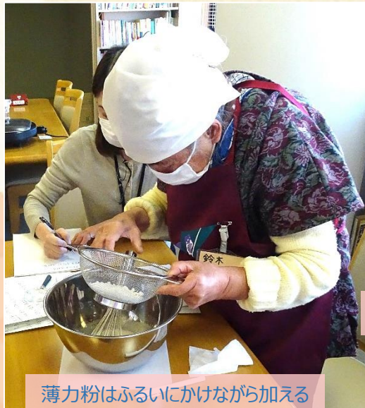
薄力粉はふるいにかけてながら加える