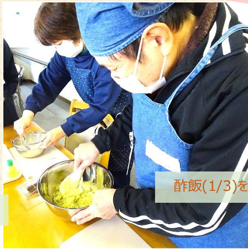
酢飯(1/3)をアボカドでみどり色にする