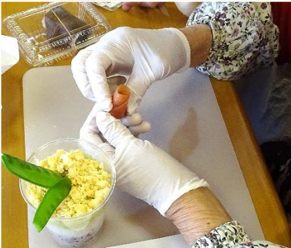
卵、さやえんどう、サーモンフラワーを飾る