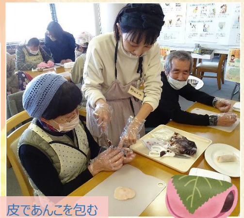
皮であんこを包む