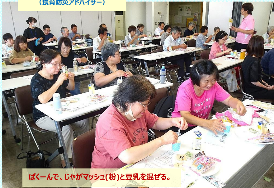
ぱくーんで、じゃがマッシュ(粉)と豆乳を混ぜる。