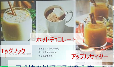
ホットチョコレート エッグノック アップルサイダー アメリカのクリスマスの飲み物