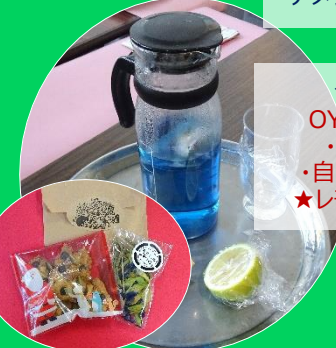
今日のお土産 OYATU 工房 といろ ・クリスマスクッキー ・自然栽培ハーブティー ★レモンを絞ると紫色に!