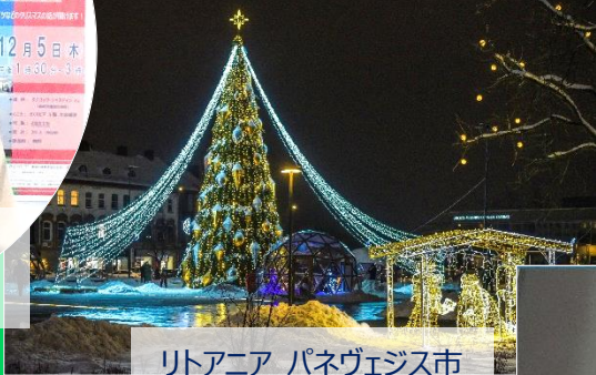
リトアニア パネヴェジス市