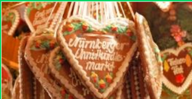
「レーブクーヘン」 クリスマスに飾るドイツのお菓子