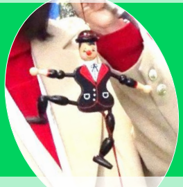
「木工人形」 ドイツの伝統工芸品